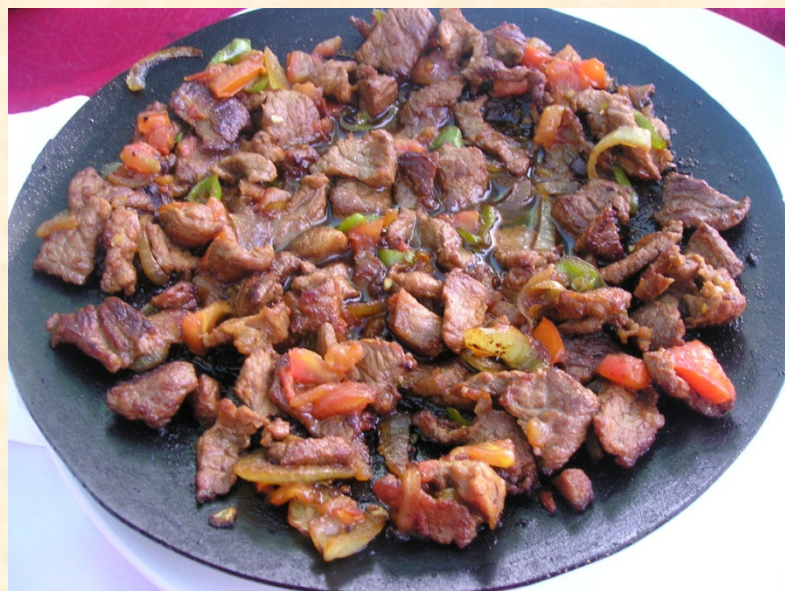
Meso z zelenjavo na žaru – Saç kavurma

Nomadski izvor Osmanov, ki so na področju današnje Turčije vladali od konca 14. st. do začetka 20. st. je pogojeval specifičen način priprave hrane. Med najbolj znanimi kulinaričnimi ostalinami tega obdobja je kebab, meso pečeno na odprtem ognju in burek ter druge vrste pit, ki so jih prav tako pekli na prostem.