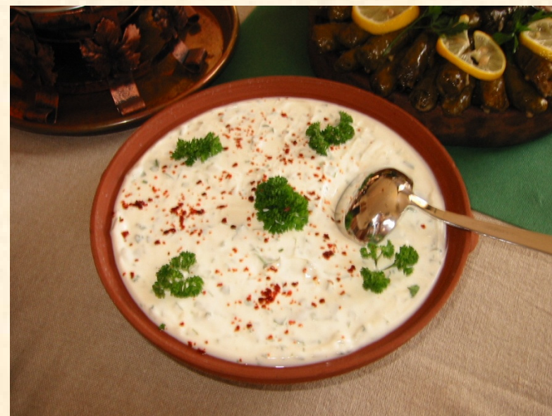
Jogurtov zeliščni namaz - haydari

Nepogrešljiv del turške prehrane sta sveži sir in jogurt, ki ga servirajo kot napitek, prilogo h glavnim jedem ali osnovo za namaze. Ugodni klimatski pogoji v mediteranskem in črnomoškem delu Turčije so prispevali k pestri zelenjavni prehrani. Številne jedi so pripravljene iz jajčevcev, bučk, paradižnika in druge zelenjave ter dopolnjene z rižem ali različnimi vrstami žit kot je bulgur.