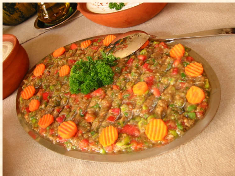
Solata iz jajčevcev – Patlican salat