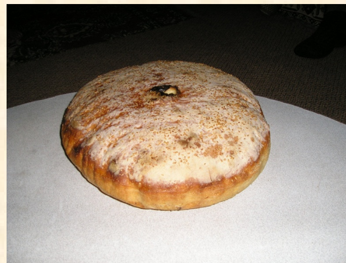
Kruh - Ekmek